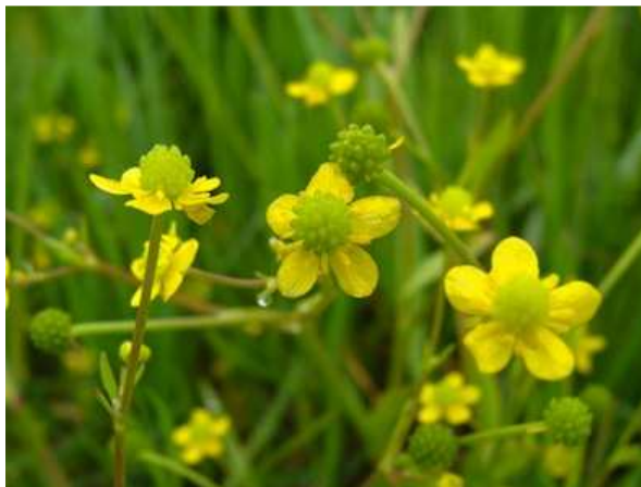
Renoncule à feuille d'ophioglosse, Rémi Fraisse en était spécialiste

http://www.lcp.fr/actualites/politique/165507-info-lcp-bruxelles-va-lancer-une-procedure-d-infraction-contre-le-barrage-de-sivens