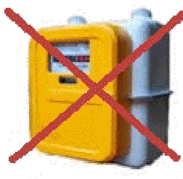
pour le gaz