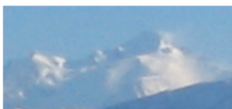
Le Mont Blanc, vu d'Annemasse

Le Point du 15 mars : archipel du Vanuatu, dans le Pacifique, cyclone d'une force qualifiée d'historique, à ces adresses http://www.lepoint.fr/monde/le-vanuatu-devaste-par-le-cyclone-pam-15-03-2015-1912960_24.php ; http://www.lemonde.fr/planete/article/2015/03/16/cyclone-pam-le-difficile-acheminement-de-l-aide-humanitaire_4594188_3244.html