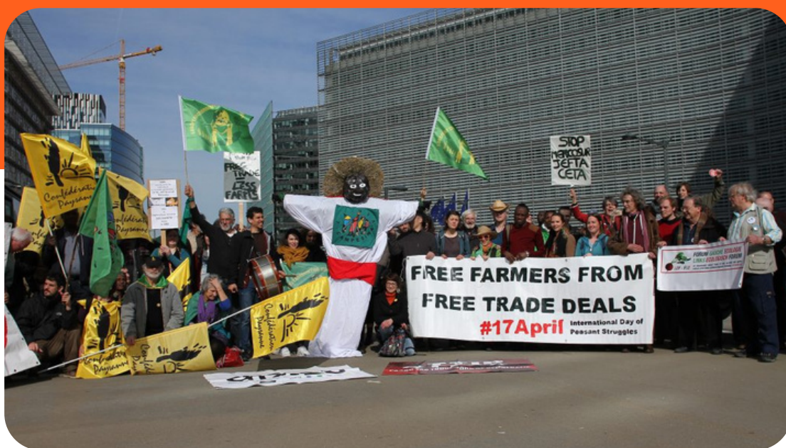
Mobilisation paysanne contre les accords de libre-échange devant la Commission européenne

La Commission européenne et plusieurs Etats-membres de l'UE souhaitent profiter de l'élection de Lula au Brésil pour ressusciter l'accord de libéralisation du commerce entre l'UE et les pays du Mercosur (Brésil, Argentine, Uruguay, Paraguay). Depuis 2019, ce projet d'accord avait de fait été gelé en raison de la mobilisation de la société civile dénonçant ses conséquences tant sur le plan écologique et social, qu'en termes de violations des droits humains, et en raison de la situation politique au Brésil. Mais le processus de finalisation et de ratification de l'accord devrait reprendre au premier semestre 2023.