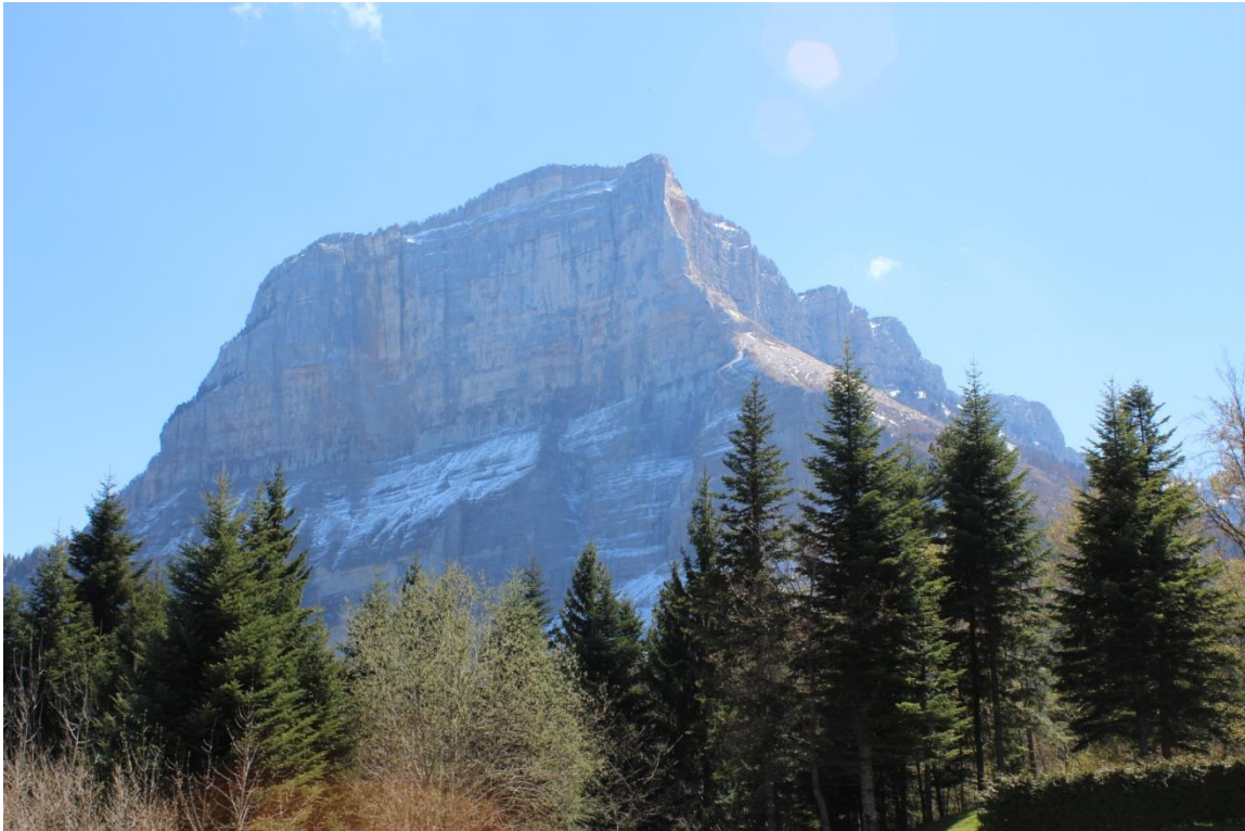
Le Granier le 29 avril 2016, photo © Oikos Kai Bios

France 3 http://france3-regions.francetvinfo.fr/alpes/un-pan-de-la-montagne-s-effondre-dans-le-mont-granier-au-dessus-d-entremont-le-vieux-900893.html