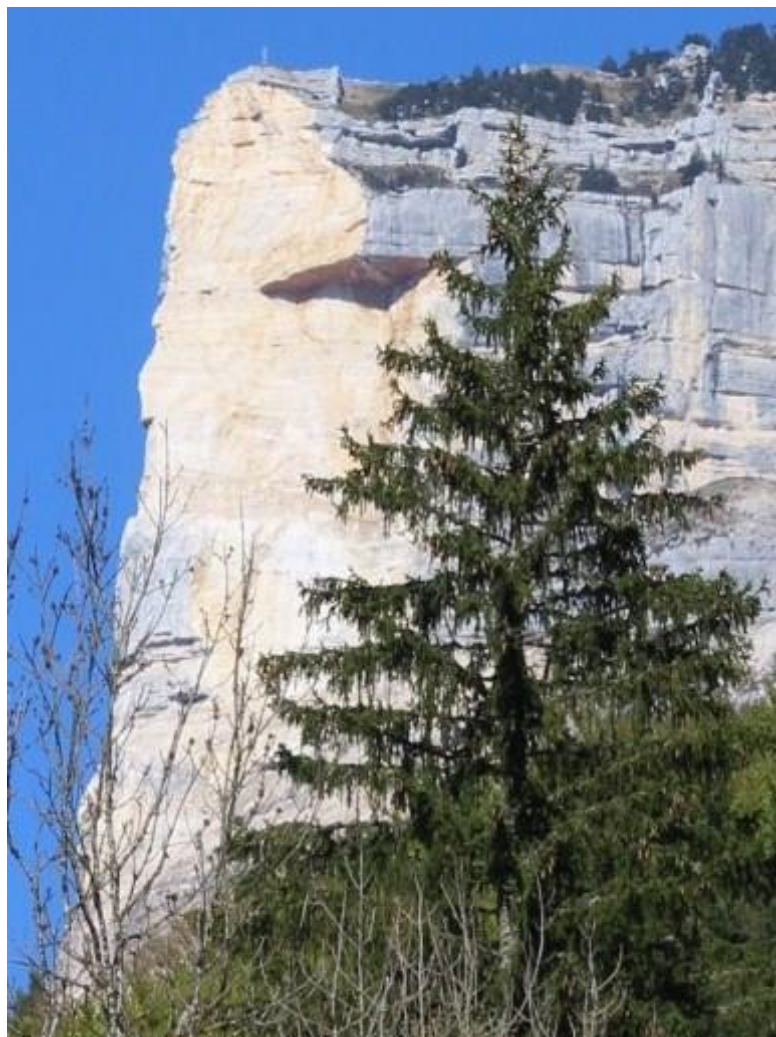
Le Granier le 29 avril 2016, photo © Oïkos Kai Bios

Les éboulements réitérés de ce massif, dont les derniers en mai 2016, sont un sujet d'inquiétude, entre autres pour le maire de Chapareillan (Isère) (6)